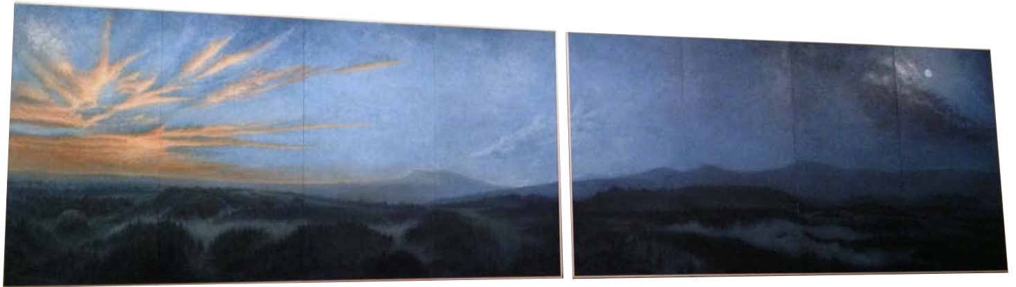
「ただ祈るということ」2012 oil on board / H1800 mm × W7200 mm

2016年ナガノオルタナティブは「ランドスケープ」をテーマに、初回企画を画家香山洋一氏を招聘展示する。