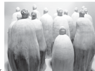
cluster high 400 mm~600 mm x wide 150 mm~200 mm x depth 150 mm~200 mm ¥ 30,000~¥ 40,000