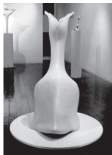
portrait II high 1000 mm x wide 440 mm x depth 550 mm ¥ 500,000-

私は人の姿を表現したいと思い制作しています。 作品を発表始めた東京での生活の中で、樹木のように成長していく姿を想像して樹日(じゅひ)と言う作品を制作しました。そして長野に帰り素材を焼き物に変え半具象的な表現をクラスターと名付けて制作し始めました。これまで制作してきた作品の移り変わりを一緒に観ていただき、何かイメージして頂けたらと思います。