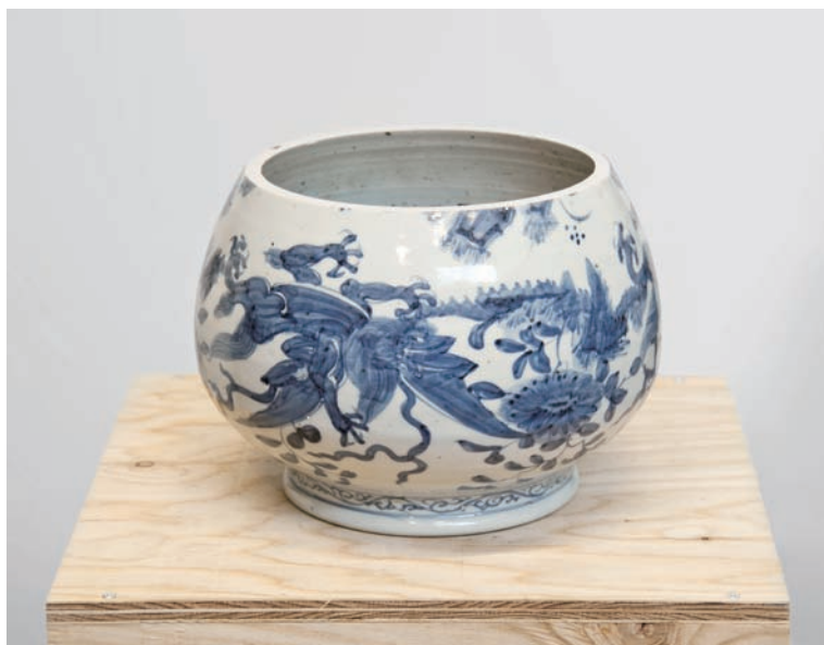
きつちよむの壺 (大明高暦年製) 2015 陶器 (伝明朝) を切断、継ぐ 24×24×18.5 cm