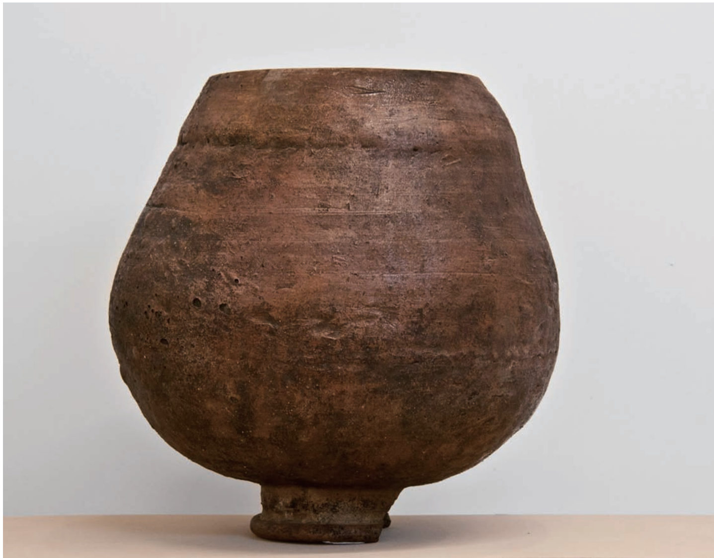
きつちよむの壺 (わっとひるげる) 2015 古信楽 (伝室町時代) を切断、継ぐ 34×34×42.5 cm