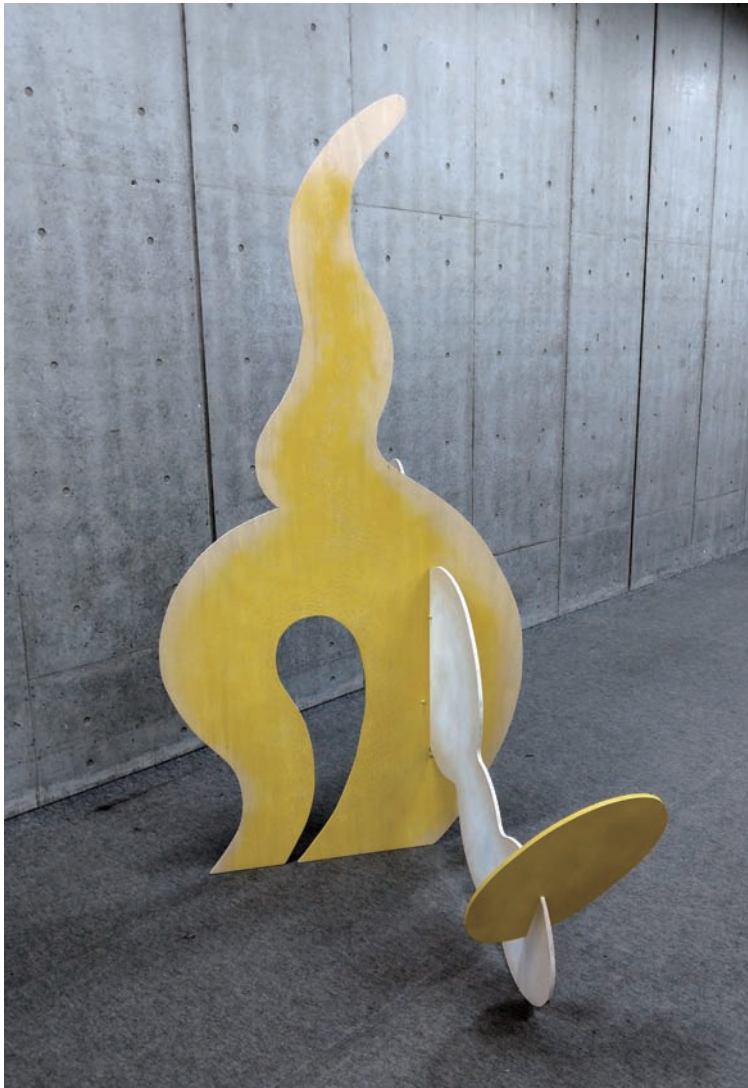
呼吸 / 2018年 / 合板 / H240×W121×D190cm